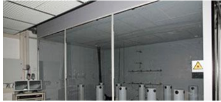
TEST TESİSLERİ HAVA DAĞITIM TEKNOLOJİSİ