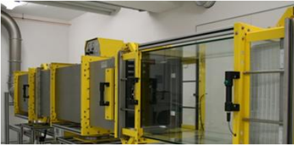
YÜKSEK İSTEKLER İÇİN İTBE TEKNOLOJİSİ