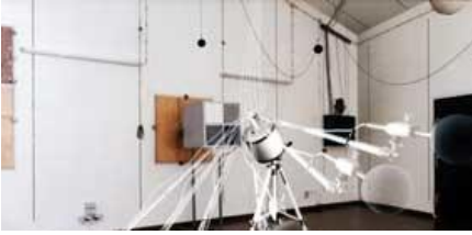
JSTURUCU ÖLÇÜMLERİ KUSTİK