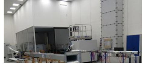
TEST TESİSLERİ KONTROL TEKNOLOJİSİ